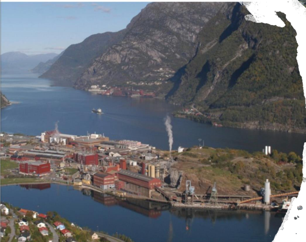
Oververket til Boliden Odda øker kapasiteten med 30.000 tonn i 2017.